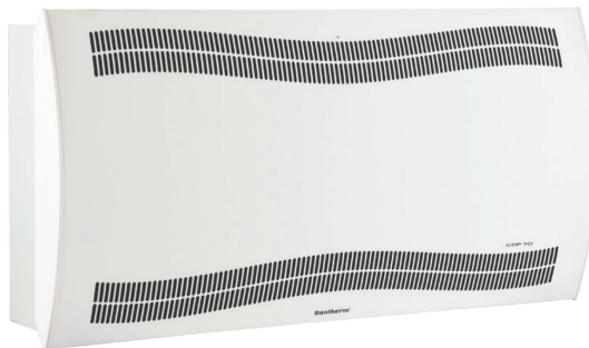
CDP svømmebadsaffugter til montage i poolrum