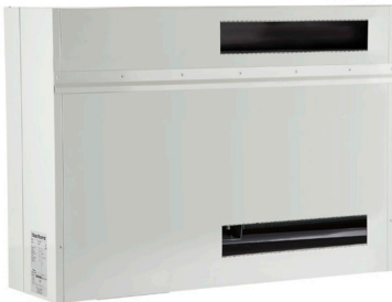
CDP-T svømmebadsaffugter til montage i teknikrum